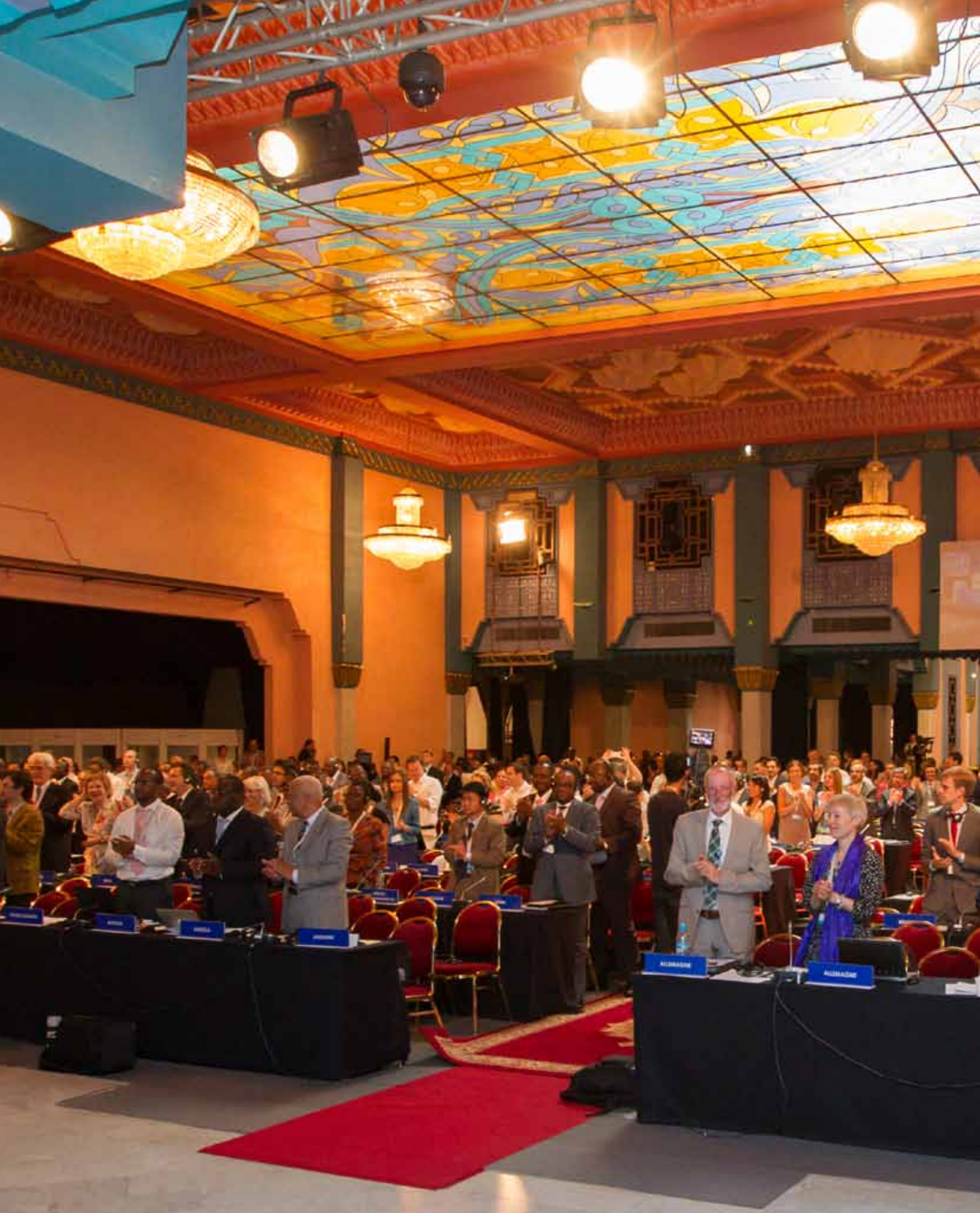
ПРЕДСТАВИТЕЛИ СТРАН, ЧЛЕНОВ ВОИС, ПРИВЕТСТВУЮТ ПРИНЯТИЕ МАРРАКЕШСКОГО ДОГОВОРА.