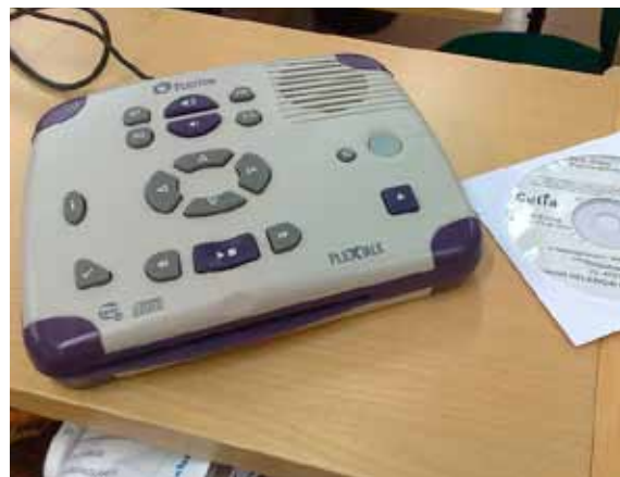
DAISY-ПЛЕЕР И АУДИОКНИГА В БИБЛИОТЕКЕ ХЕЛЬСИНКИ- СИТИ. НА ФОТО: MACE

EIFL в сотрудничестве со Всемирным союзом слепых оказывает поддержку библиотекам в странах-партнерах, в частности, в их деятельности по поддержке ратификации договора . Когда договор будет имплементирован в национальное законодательство, библиотеки смогут оказывать ряд услуг, разрешенных по договору, включая создание и распространение экземпляров произведений в доступном формате для лиц с ограниченными способностями воспринимать печатную информацию, тем самым, библиотеки смогут внести свой вклад в прекращении «книжного голода».