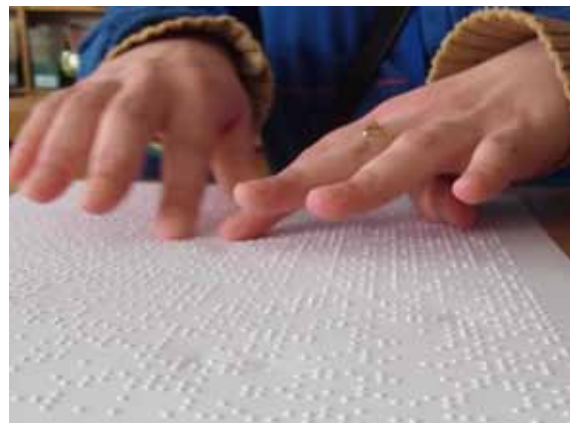
НА ФОТО: ЛИТОВСКАЯ БИБЛИОТЕКА ДЛЯ СЛЕПЫХ

С практической точки зрения, самым важным положением договора для библиотек является определение термина «уполномоченный орган», поскольку он определяет организацию, которая изготавливает и распространяет экземпляры в доступном формате, а также условия такого изготовления и распространения. В статье 2(с) уполномоченный орган определяется как орган, уполномоченный или признанный правительством в качестве органа, предоставляющего бенефициарам на некоммерческой основе услуги в области образования, профессионального обучения, адаптивного чтения или доступа к информации. Он также включает правительственное учреждение или некоммерческую организацию, которое занимается предоставлением бенефициарам аналогичных услуг в качестве одного из своих основных видов деятельности или институциональных обязательств. 5