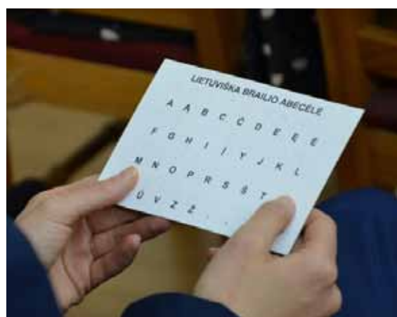
ЛИТОВСКИЙ АЛФАВИТ БРАЙЛЯ. НА ФОТО: ЛИТОВСКАЯ БИБЛИОТЕКА ДЛЯ СЛЕПЫХ

Статья 5(4) предоставляет защитные меры, согласно которым получающая страна, не имеющая обязательств в отношении применения трехступенчатой проверки, обеспечит, чтобы уполномоченный орган не мог реэкспортировать экземпляр в доступном формате в другую страну, или же, что изготовление экземпляра в доступном формате подлежит прохождению трехступенчатой проверки, до того, как такой экземпляр может быть отправлен в получающую страну. 17